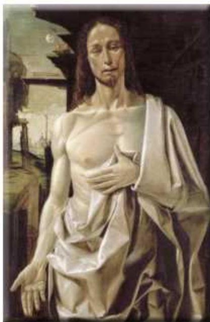
Bramantino, Uomo dolente o Cristo risorto, 1490 ca., Madrid, Museo Thyssen-Bornemisza