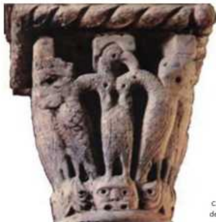
Capitello medievale nella sala del Cenacolo a Gerusalemme.

"Sapete cosa fa il pellicano quando i suoi piccoli sono affamati e non ha il cibo da offrire loro? Si ferisce il petto con il suo lungo becco e ne fa sgorgare sangue nutriente per i piccoli, che si abbeverano alla sua ferita come ad una fonte. Come ha fatto Cristo con noi; ed è per questo che spesso è rappresentato come un pellicano. Ha sconfitto la nostra morte di piccoli affamati di vita donando il suo sangue, il suo amore indistruttibile, per noi. E il suo dono è più forte della morte. Senza questo sangue moriamo due volte..."